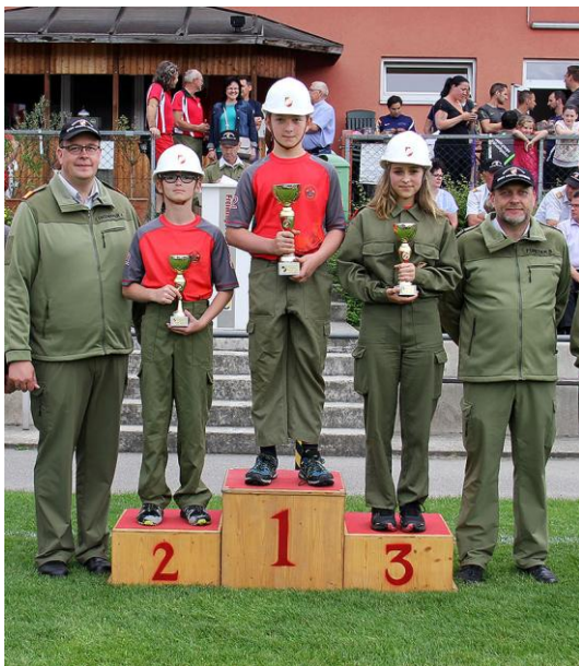
Geng1 den 3. Rang

Das harte Training hat sich bezahlt gemacht und somit erreichte die Jugendgruppe im neuen Klassensystem unseres Bezirkes in der Bezirkswertung