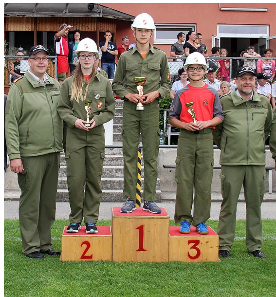
und Geng2 den 2.Rang in der 2.Klasse.