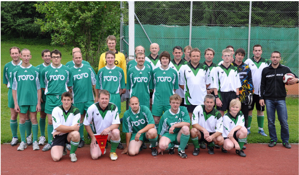
Die Kampfmannschaft der Partnerfeuerwehr und unsere Fußballer beim Freundschaftsspiel