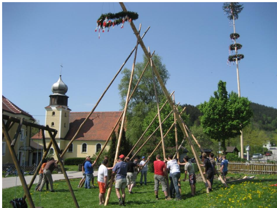
Der gestohlene Maibaum aus Sonnberg wird beim Günter im Garten aufgestellt.