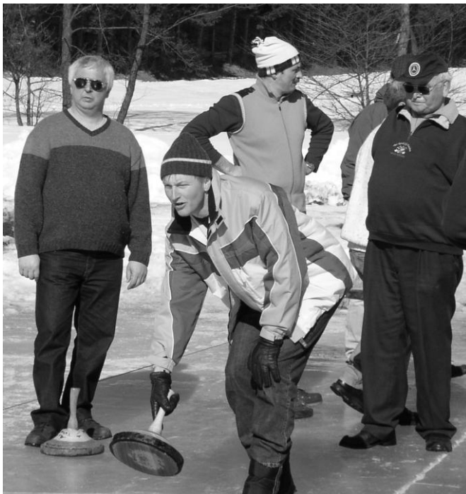
Das Stockturnier mit unserer Partnerfeuerwehr aus Bayern wurde am 23. Februar veranstaltet.

Am 15.02. 2003 fand, in Kooperation mit den Feuerwehren Eidenberg und Berndorf, unser jährlicher Feuerwehrball im Gasthaus Pargfrieder statt. Außerdem besuchten wir den Feuerwehrball der Feuerwehren Kirchschatz und Kronabittedt.